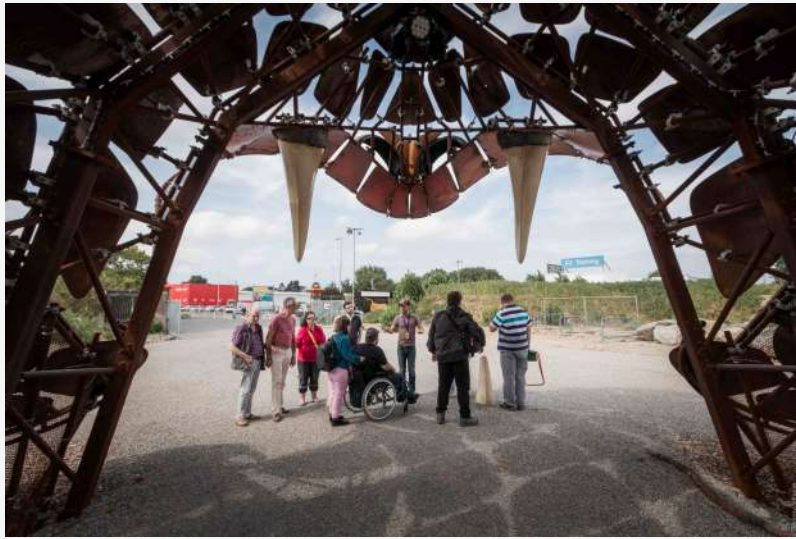
Une visite tactile organisée à Transfert pour des personnes non et mal voyantes.

Dans le cadre de cette occupation transitoire, Transfert interroge la construction de la ville de demain et souhaite permettre à l'ensemble des citoyens de prendre part à cette réflexion déterminante. Pick Up Production cherche à puiser dans cette expérience pour imaginer un véritable lieu de vie adapté dans lequel le public en situation de handicap peut trouver sa place en toute sérénité.