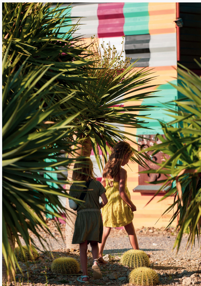
Usages spontanés : partie de Mölkky hors des aires de jeu, lecture debout et promenade au milieu des cactus